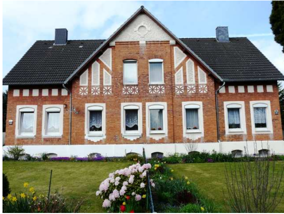
Wohnhaus in der Theodor-Heuss-Straße in Ronnenberg

Auf den Werksgeländen in Ronnenberg und Empelde sind nur die ehemaligen Verwaltungsgebäude erhalten geblieben.